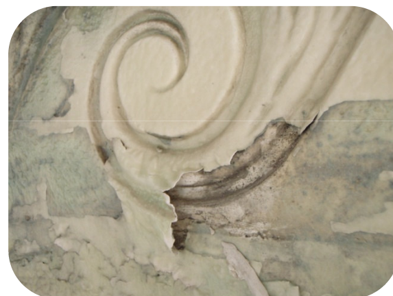
Kemiens effekt på tykt malingslag der skal fjernes fra puds ses tydeligt

Spartelprodukter og silikatmalinger kan IKKE fjernes med denne metode.